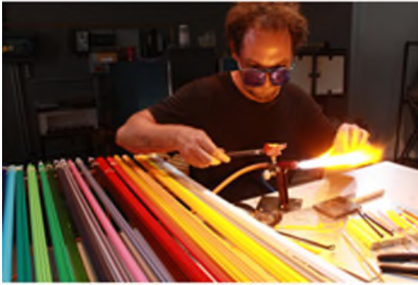
Démonstration de filage de verre