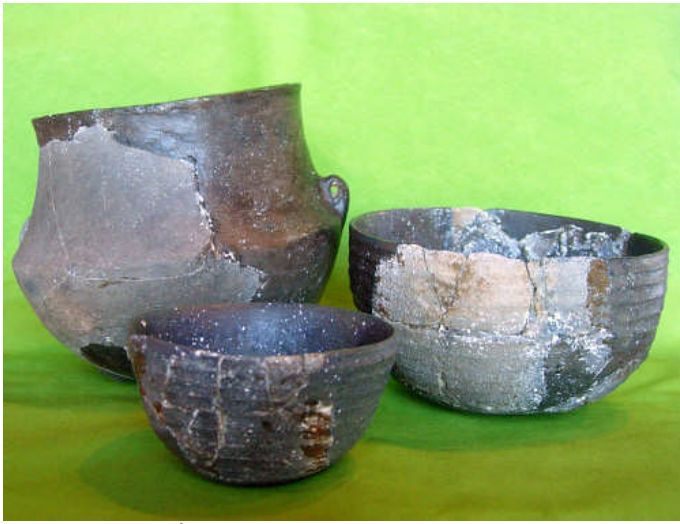
Céramiques, culture de Fontbouisse, fouilles Archéa à La Capelle

Depuis une vingtaine d'années, des fouilles menées dans la région d'Uzès ont permis de trouver la trace des habitants d'il y a 4000 ans. Comment vivaient-ils au quotidien ? Et quelles étaient les caractéristiques de leur culture, la culture de Fontbouisse (2800 à 2400 av. JC) ?