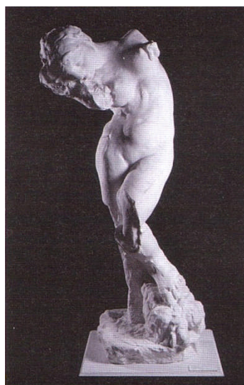
Voix Intérieure, Rodin

Rendez-vous au Musée départemental Arles antique, Presqu'île du Cirque-Romain, le 7 juin à 14 h 45, pour une visite guidée de l'exposition « Rodin, lumière antique ».